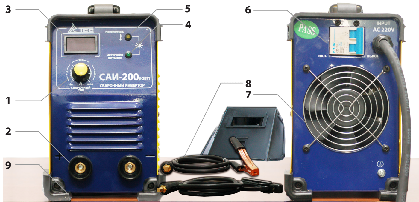
1 - регулировка сварочного тока; 2 - выводы для подключения кабеля; 3 - цифровой дисплей; 4 - индикатор сети; 5 - индикатор перегрузки; 6 - автомат защиты сети; 7 - вентилятор; 8 - кабель; 9 - прорезиненные углы.