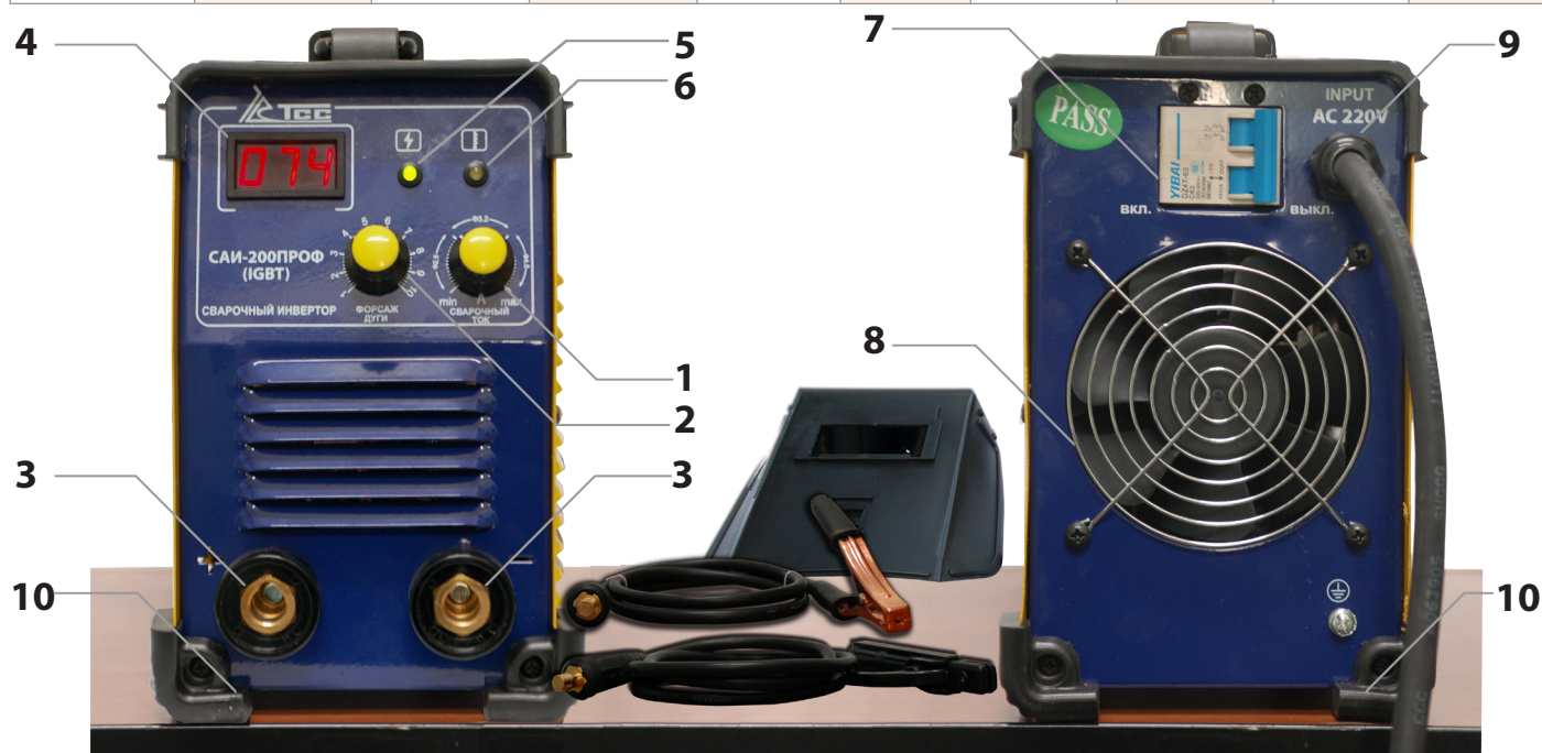
1 - регулировка сварочного тока; 2 - регулировка форсажа дуги; 3 - выводы для подключения кабеля; 4 - цифровой дисплей; 5 - индикатор сети; 6 - индикатор перегрузки; 7 - автомат защиты сети; 8 - вентилятор; 9 - кабель; 10 - резиновые углы.